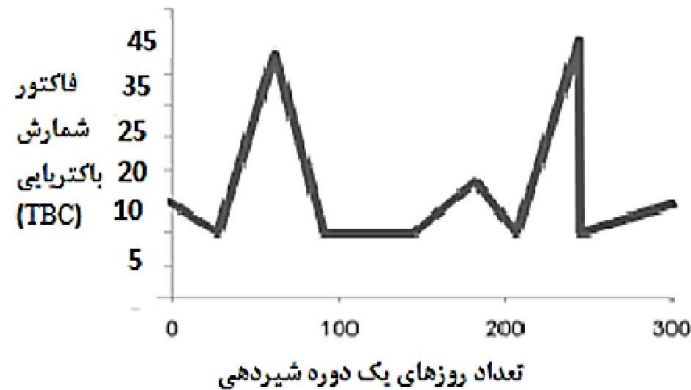
شکل ۳- بررسی فاکتور کیفی TPC در شیر با نصب سیستم‌های شیردوشی اتوماتیک

به عنوان مثال عامل TBC در شیر در ماشین‌های شیردوشی رباتیک مورد بررسی قرار گرفت (شکل ۳). همان‌طور که مشاهده می‌شود در ماه‌های اولیه نصب سیستم اتوماتیک تعداد فاکتور باکتریایی در شیر یک روند نوسانی داشت که دلیل این نوسانات ناشی از عدم تطبیق پذیری این نوع از ماشین‌ها در واحدهای تولید شیر محسوب می‌شد، اما این پارامتر کیفی شیر به مرور و با گذشت زمان به حالت ثابت (روند تقریباً ثابتی) بر می‌گشت (Lely Group, 2014).